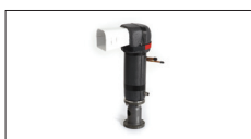
Evaporatore in Acciaio AISI 304