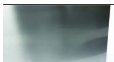
Carrozzeria AISI 304 Scotch Brite