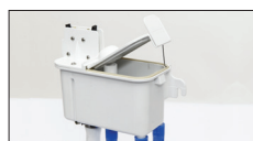
Bacinella acqua sigillata antipolvere