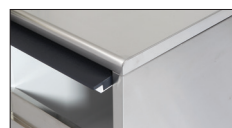
Sportello isolato con apertura a scomparsa