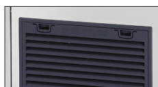
Filtro Aria smontabile e pulibile